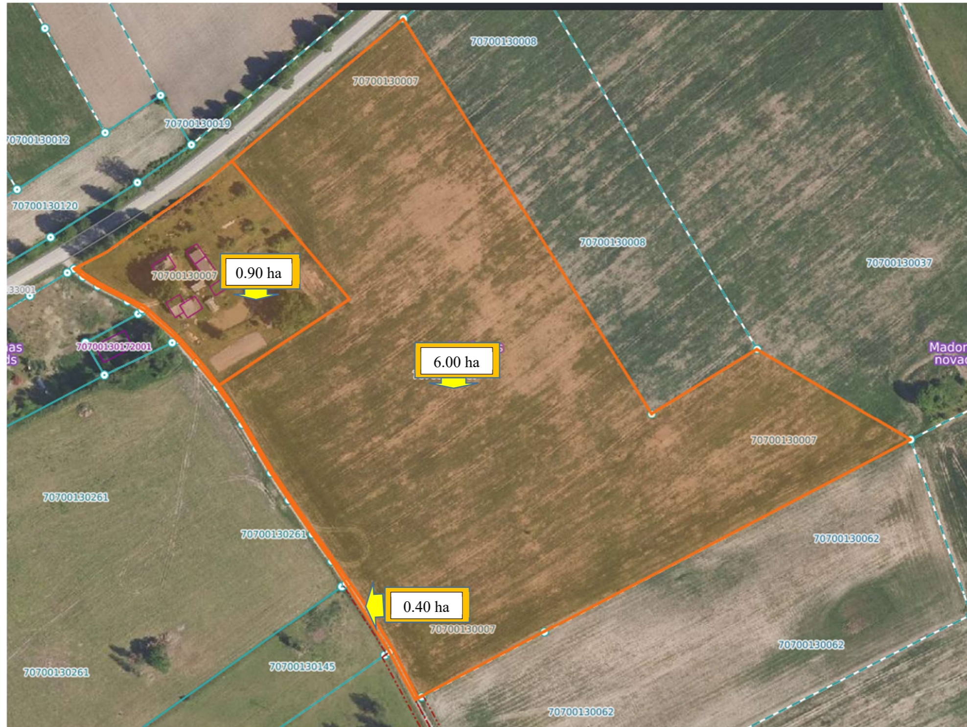
Zemes vienības ar kadastra apzīmējumu 70700130007 sadalīšanas shēma*

Datu avots https://www.lvmgeo.lv/kartes 2026. gada informācija